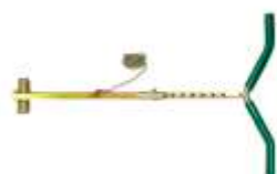
Support telescopic de sprijin