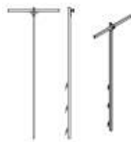
Dispozitiv de extindere - retragere