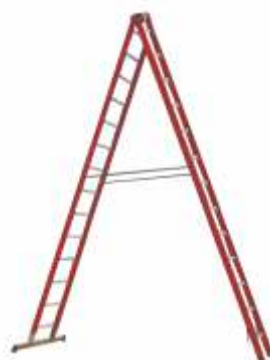
Scară IRMUT multifuncțională cu lonjeroane din PAFS - 2 tronsoane -