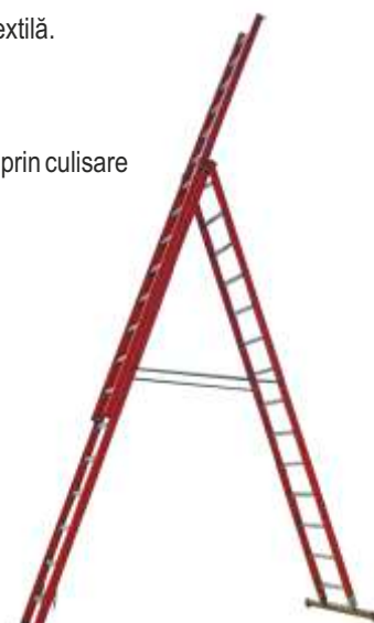
Scară IRMUT multifuncțională cu lonjeroane din PAFS - 3 tronsoane -