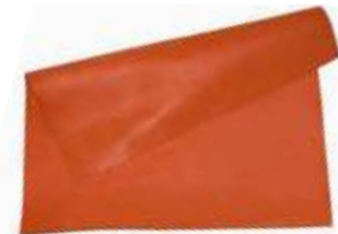
FOLIE (PĂTURĂ) CAUCIUC