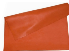
FOLIE (PĂTURĂ) CAUCIUC