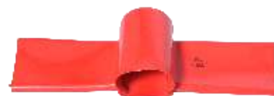
Model 665 - 220

Tecile electroizolante sunt realizate din PVC plastifiat, de culoare roșie, rezistent la radiațiile ultraviolete și se livrează în tipodimensiunile din tabelul de mai jos.