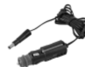
CABLU DE ÎNCĂRCARE AUTO