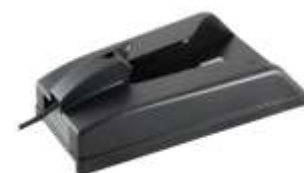
SUPORT DE ÎNCĂRCARE + CABLU DE ÎNCĂRCARE 230 V c.a.