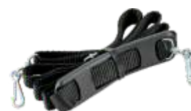
CUREA PENTRU TRANSPORT PE UMĂR