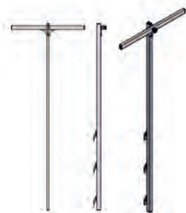
Dispozitiv de extindere - retragere