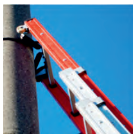
Sistem de sprijin, rulare și legare