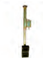
Picior detașabil, reglabil pe înălțime