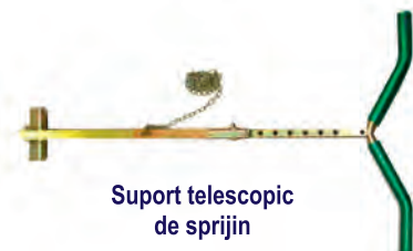
Suport telescopic de sprijin