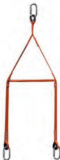
Ham de ridicare AT 300 (opțional)