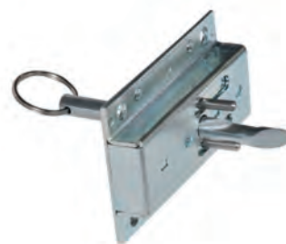
ZĂVOARE ANTIVANDALISM - VARIANTA DIN TABLĂ BIT 85T / BIF 60T